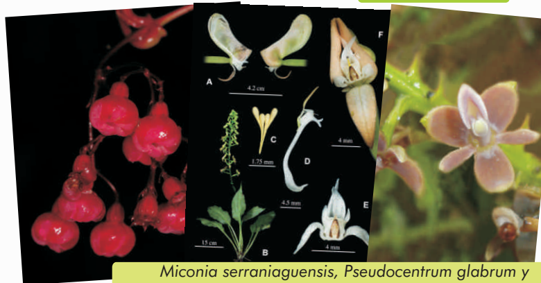
Miconia serraniaguensis , Pseudocentrum glabrum y Epidendrum ionostachyum