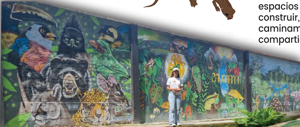
Calle Aula Ambiental _ Arboretum Escolar