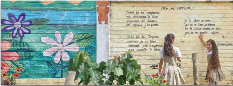
Calle de los poetas - El Cairo Valle