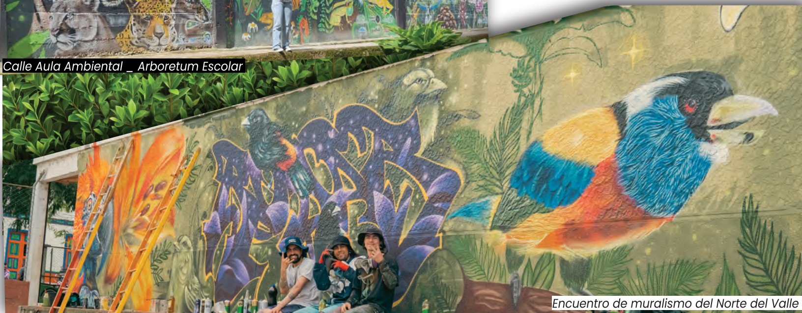
Encuentro de muralismo del Norte del Valle